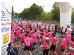
▲ ... et les coureurs en rose s'élancent !