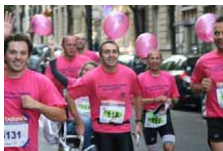
Les femmes étaient à l'honneur pour cette édition 2010 ►

« Merci beaucoup de m'avoir permis de courir cette belle course des 20 km de Paris sous les couleurs de l'association DEFI. Je vais adhérer avec grand plaisir pour contribuer à sa mission », disait un coureur à son arrivée.